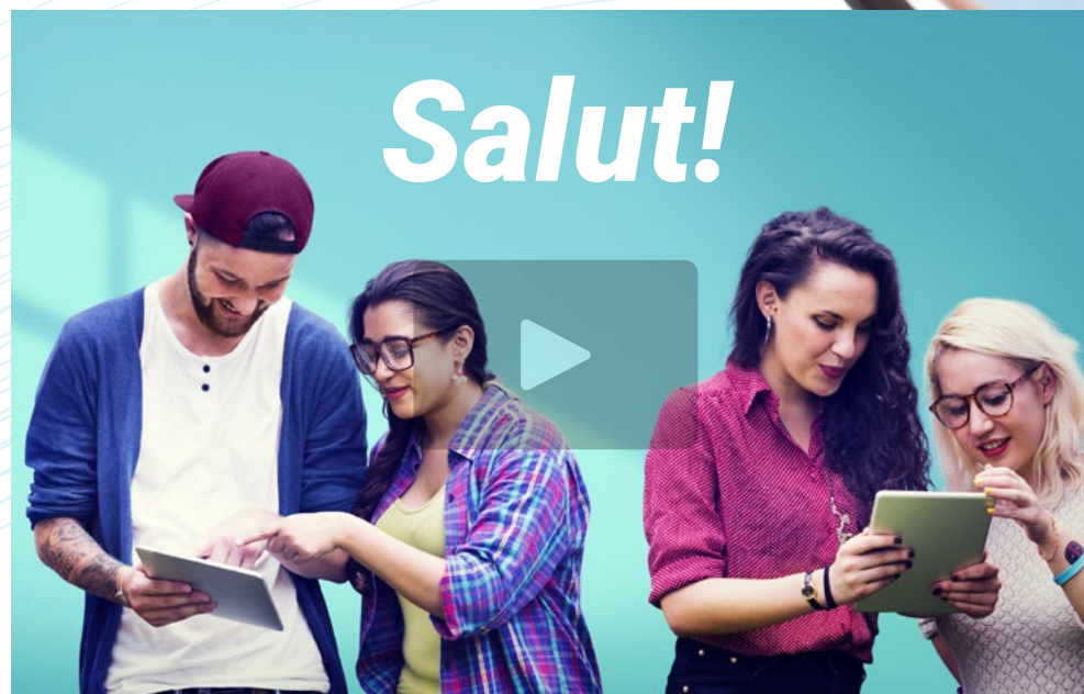
Video di presentazione

Per accedere alle migliori opportunità, una certificazione universitaria di livello B2 in francese può fare la differenza tra l'avanzare in un processo di selezione o essere scartati. Per questo motivo, questo esame di lingua francese livello B2 sottolinea le premesse più importanti del QCER, al fine di adattarlo alle esigenze internazionali.