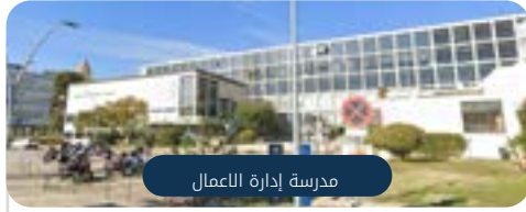
مدرسة إدارة الأعمال