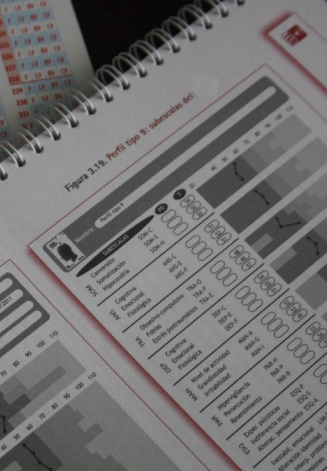
Figura 3.19. Perfil tipo 9: subescalas del: