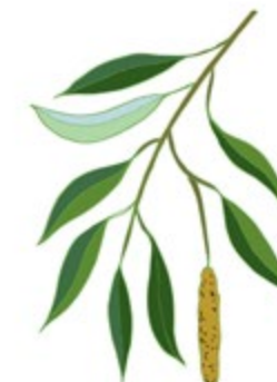
WHITE WILLOW BARK