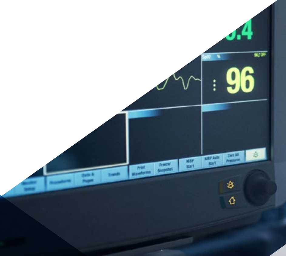
Imagen Clínica para Urgencias, Emergencias y Cuidados Críticos