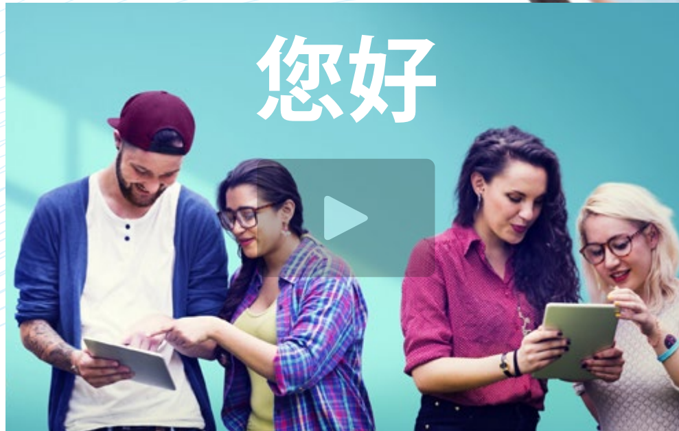
Vídeo de presentación

Los programas de idiomas de TECH cuentan con el respaldo del más importante sistema de reconocimiento de idiomas: el Marco Común Europeo de Referencia para las Lenguas. Así, este examen universitario conduce a la obtención de un certificado de Nivel C2 de Chino acorde a los estándares del MCER, por lo que el estudiante que haya superado la prueba podrá participar en numerosos procesos profesionales y académicos que requieran de un dominio absoluto de este idioma.