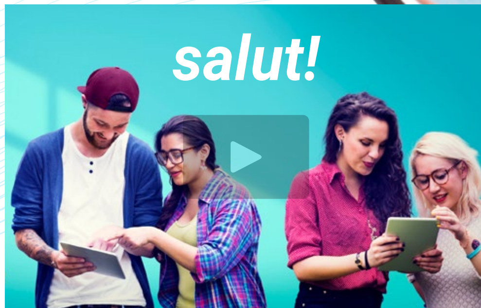
Vídeo de presentación

El Nivel A2 MCER de Francés es una excelente puerta de entrada hacia un futuro laboral mejor. Al contrario de otras lenguas como el alemán, el francés no tiene declinaciones, lo que hace mucho más sencillo su estudio. Por ello, el candidato no deberá invertir excesivas horas en alcanzar las competencias adecuadas para superar este Examen de Idiomas, sino que podrá alcanzarlas sin problema alguno.