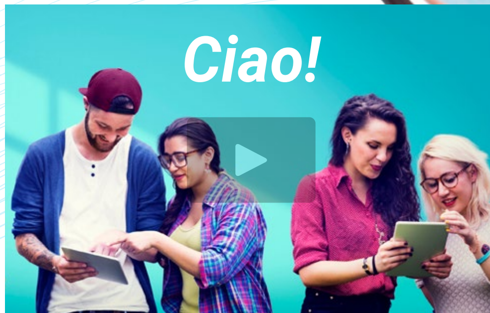
Vídeo de presentación

Los programas universitarios de idiomas de TECH han sido diseñados específicamente para dar respuesta a todos los retos del mundo actual. Así, la certificación de idiomas es uno de los elementos más solicitados por distintas instituciones en numerosos procedimientos laborales, académicos y administrativos. De esta manera, este Examen del Nivel A1 MCER de Italiano conduce a la obtención de un diploma acreditativo del Marco Común Europeo de Referencia para las Lenguas, que reflejará todas las competencias lingüísticas adquiridas por el alumno.