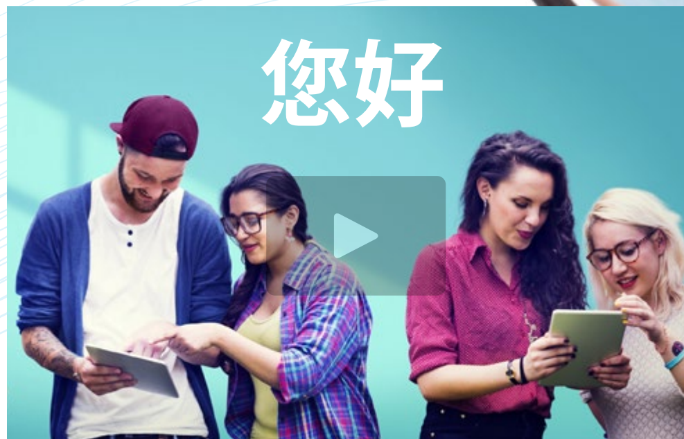
Vídeo de presentación

El chino es el segundo idioma más hablado del mundo. Actualmente, entre nativos y no nativos, se calcula que más de 1.000 millones de personas hablan esta lengua. No es de extrañar, por tanto, que este sea uno de los idiomas más efectivos a la hora de acceder a mejores oportunidades profesionales. Pero, muchas veces, para acceder a esas oportunidades es necesario tener una acreditación de nivel. Por eso, esta prueba universitaria permite al estudiante certificar el Nivel A1 MCER de Chino en función de lo establecido por el Marco Común Europeo de Referencia para las Lenguas. Todo ello, de forma cómoda, flexible y completamente adaptada a sus necesidades.