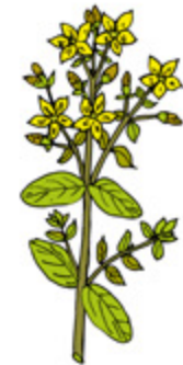
ST. JOHN'S WORT