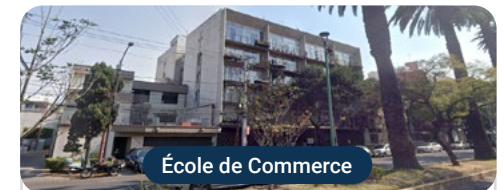
École de Commerce