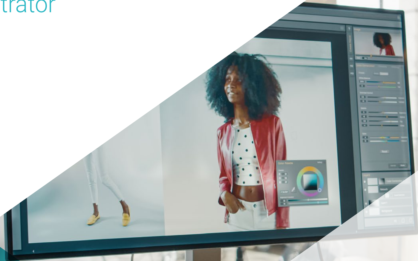
Ilustración Vectorial de Packaging con Adobe Illustrator