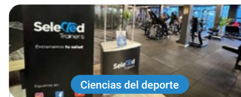
Ciencias del deporte