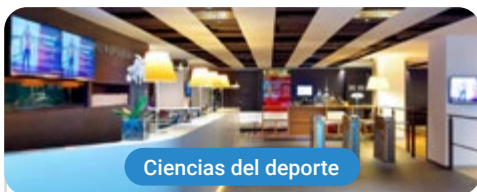
Ciencias del deporte