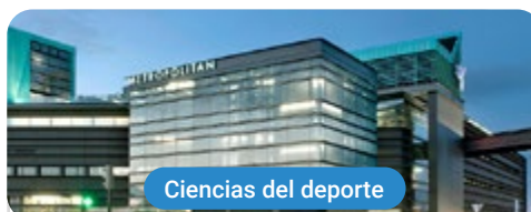
Ciencias del deporte

Capacitaciones prácticas relacionadas: -Entrenamiento Personal Terapéutico -Monitor de Gimnasio