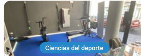
Ciencias del deporte