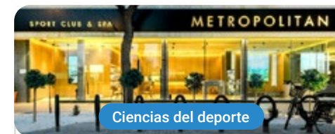
Ciencias del deporte

Capacitaciones prácticas relacionadas: -Entrenamiento Personal Terapéutico -Monitor de Gimnasio