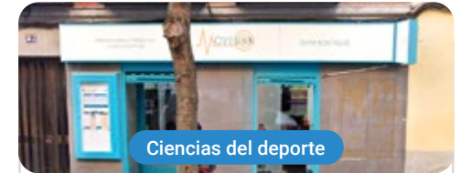
Ciencias del deporte