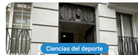
Ciencias del deporte

Capacitaciones prácticas relacionadas: -Entrenamiento Personal Terapéutico -Monitor de Gimnasio