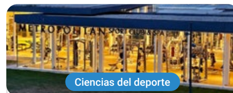
Ciencias del deporte

Capacitaciones prácticas relacionadas: -Entrenamiento Personal Terapéutico -Monitor de Gimnasio