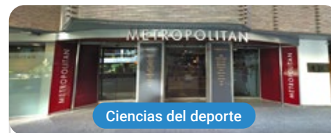
Ciencias del deporte

Capacitaciones prácticas relacionadas: -Entrenamiento Personal Terapéutico -Monitor de Gimnasio