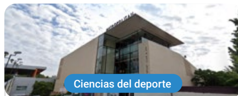
Ciencias del deporte

Capacitaciones prácticas relacionadas: -Entrenamiento Personal Terapéutico -Monitor de Gimnasio