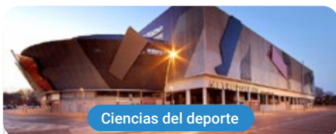
Ciencias del deporte

Capacitaciones prácticas relacionadas: -Entrenamiento Personal Terapéutico -Monitor de Gimnasio